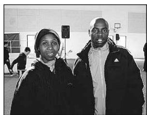
Le Kenyan avec ses deux beaux vainqueurs a plané sur Magny.